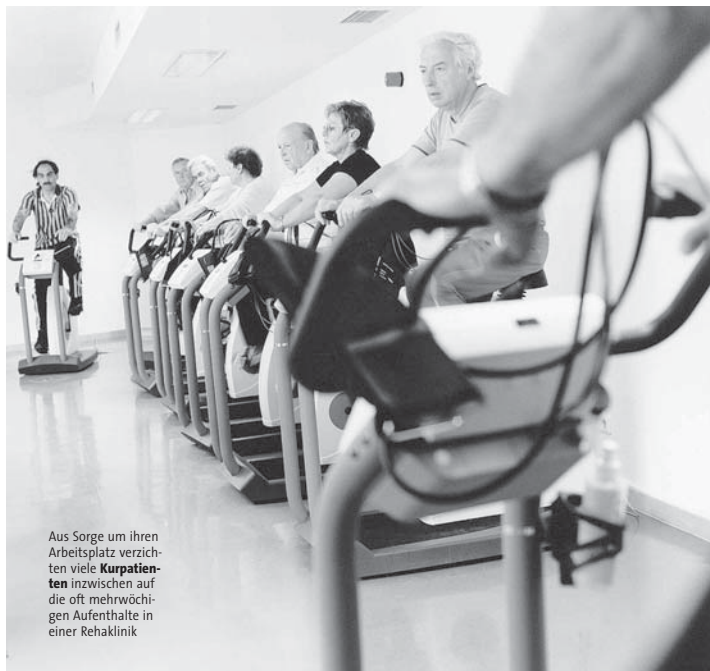
Aus Sorge um ihren Arbeitsplatz verzichten viele Kurpatienten inzwischen auf die oft mehrwöchigen Aufenthalte in einer Rehaklinik